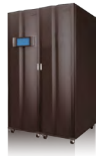
Optionaler Schaltschrank mit gleichen Außenmerkmalen und Abmessungen