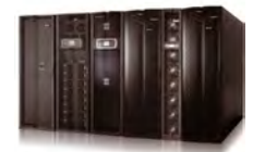
Modernes IT-Design im Stile der Delta InfraSuite Rechenzentrumslösungen