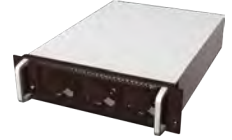
50kVA/kW in einem Raum mit 3 Höheneinheiten (3 HE)